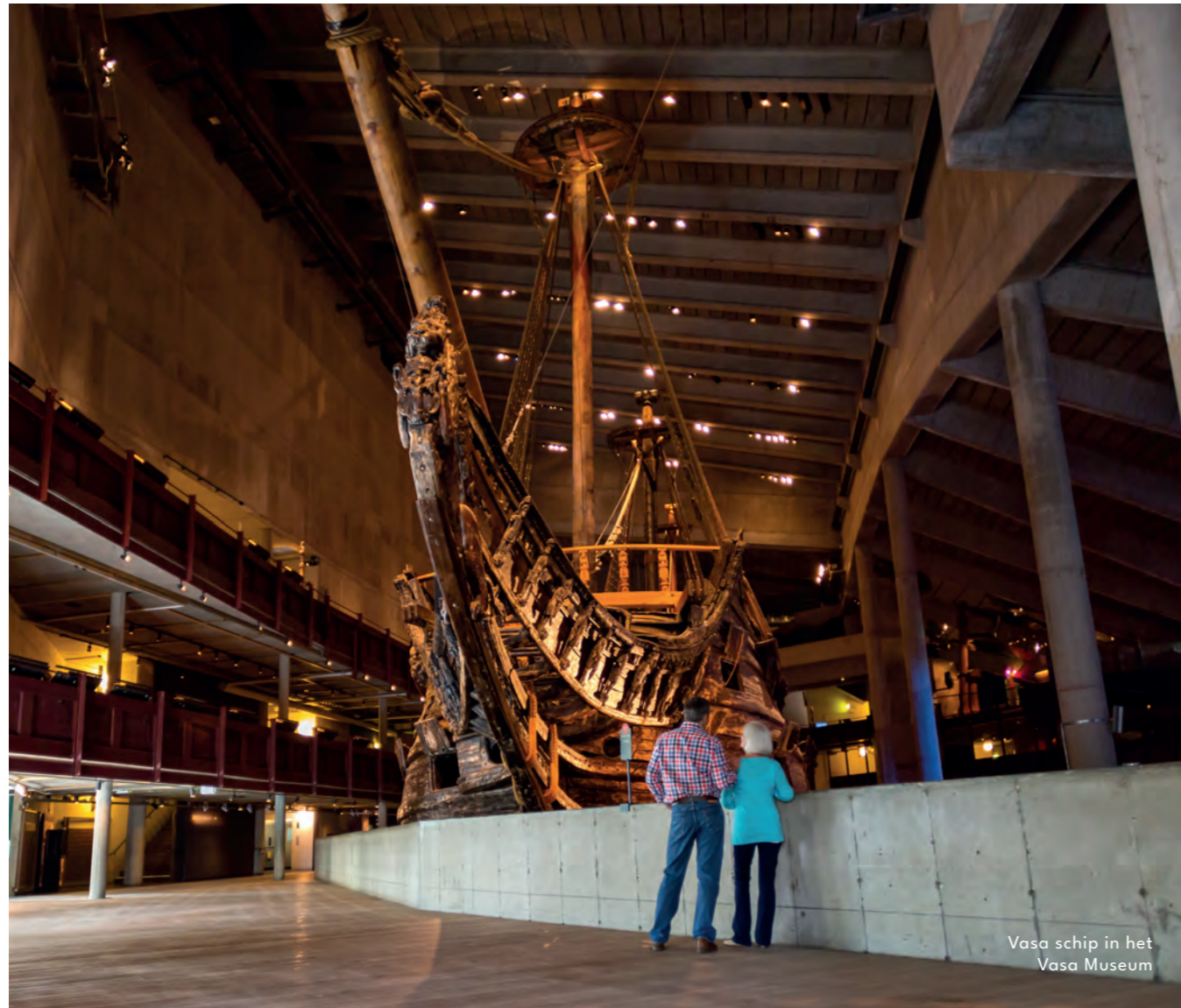
Vasa schip in het Vasa Museum