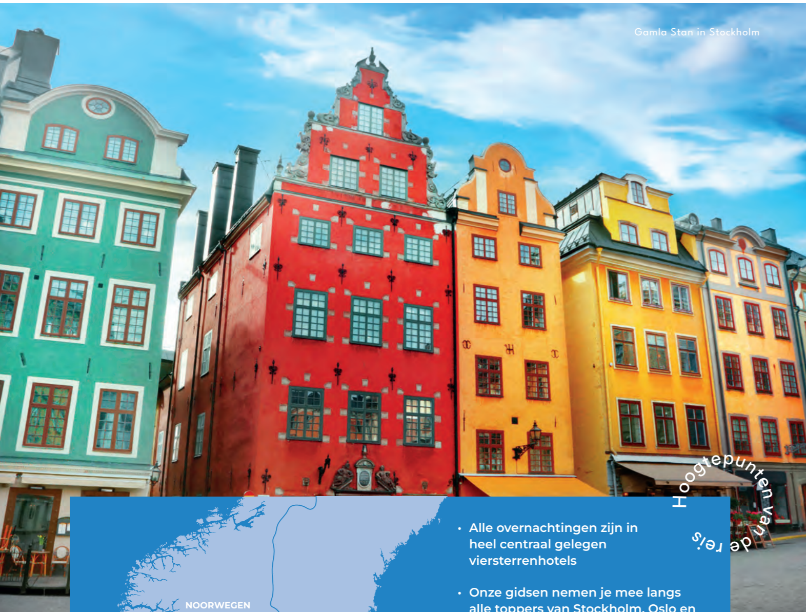
Gamla Stan in Stockholm