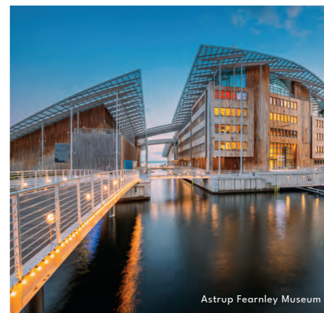
Astrup Fearnley Museum

Vandaag voorzien we de hele dag om de moderne hoofdstad Oslo te bezoeken. We starten de dag met een wandeling op het operagebouw. Een architecturale parel in Oslo met mooi zicht op de fjord. Nadien bezoeken we het Munchmuseum. Het museum staat niet alleen vol kunst van Edvard Munch, maar herbergt ook tentoonstellingen van andere bekende hedendaagse kunstenaars. Het gebouw staat bol van cultuur, en de kers op de taart is het allermooiste uitzicht over Oslo en het Oslofjord.