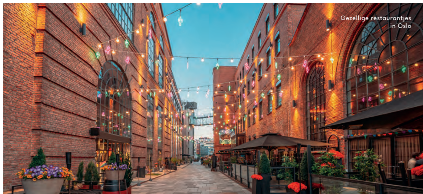
Gezellige restaurantjes in Oslo

's Avonds kun je zelf Oslo verkennen en genieten van de bruisende eetcultuur in één van de velen restaurants dat Oslo te bieden heeft.