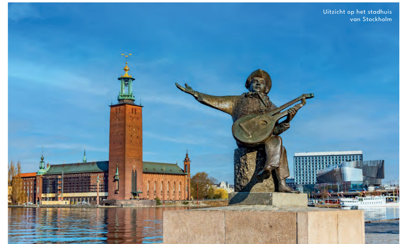
Uitzicht op het stadhuis van Stockholm

Stockholm is een bijzonder aangename en kleurrijke stad die op 14 eilanden ligt, allen met elkaar verbonden door bruggen. We starten meteen in de namiddag met een wandeling doorheen het centrum van Stockholm en Gamla Stan, het oude stadscentrum en meteen ook het gezelligste plekje van Stockholm. In dit historische deel van de stad liggen het koninklijk paleis, de kathedraal, de Duitse kerk en het Nobelmuseum op een boogscheut van elkaar. Over de Riddarholmsbrug gaat het verder naar het al even oude eiland Riddarholmen, waar we vanop Evert Taubes Terrass een adembenemend uitzicht op het stadhuis aan de oever van het meer Mälaren hebben. 's Avonds genieten we van een diner in een plaatselijk restaurant in Stockholm.