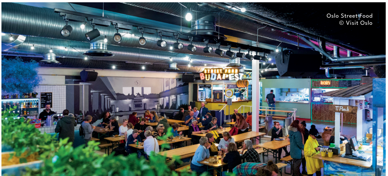
Oslo Street Food

's Avonds geven we jou de mogelijkheid om te gaan eten in "Oslo Streetfood". Een plaatselijke gallerij met verschillende eetstandjes waar we heen gaan en je op eigen houtje iets kan kopen. Een plaatselijke gewoonte waarheen we je graag meenemen.