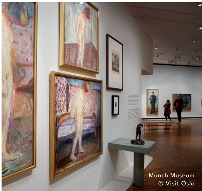
Munch Museum

Vandaag voorzien we de hele dag om de moderne hoofdstad Oslo te bezoeken. We starten de dag met een wandeling op en een bezoek aan het operagebouw. Een architecturale parel in Oslo met mooi zicht op de fjord. Nadien bezoeken we het Munch Museum. Het museum staat niet alleen vol kunst van Edvard Munch, maar herbergt ook tentoonstellingen van andere bekende hedendaagse kunstenaars. Het gebouw staat bol van cultuur, en de kers op de taart is het allermooiste uitzicht over Oslo en het Oslofjord. Je kunt bijvoorbeeld naar het café of genieten van een drankje aan de bar op het dak van de schilderachtige 13e verdieping.