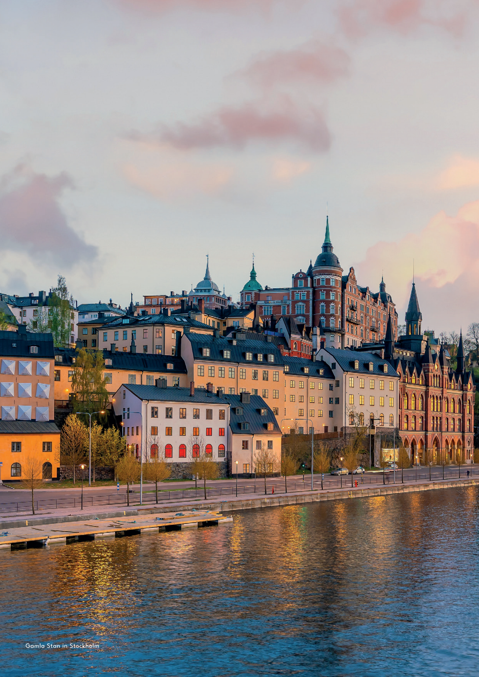
Gamla Stan in Stockholm