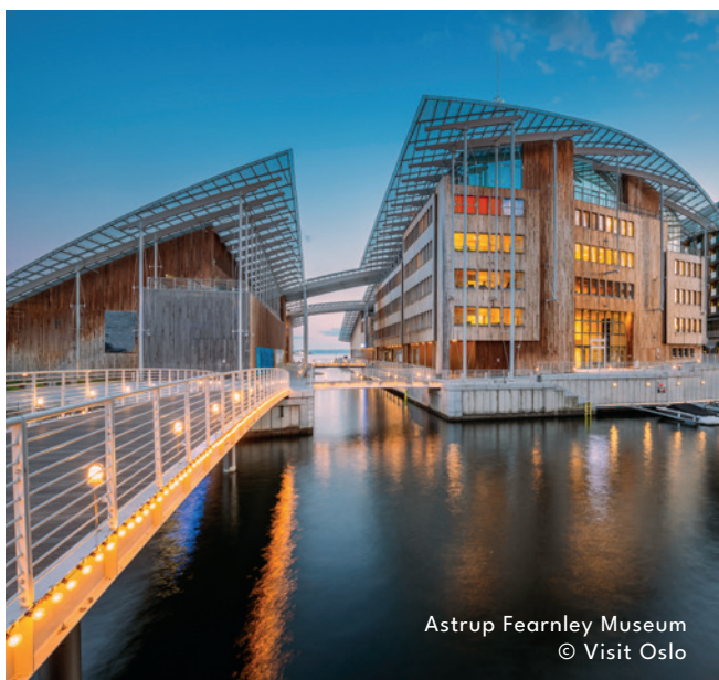
Astrup Fearnley Museum

Vandaag voorzien we de hele dag om de moderne hoofdstad Oslo te bezoeken. We starten de dag met een wandeling op en een bezoek aan het operagebouw. Een architecturale parel in Oslo met mooi zicht op de fjord. Nadien bezoeken we het Munch Museum. Het museum staat niet alleen vol kunst van Edvard Munch, maar herbergt ook tentoonstellingen van andere bekende hedendaagse kunstenaars. Het gebouw staat bol van cultuur, en de kers op de taart is het allermooiste uitzicht over Oslo en het Oslofjord. Je kunt bijvoorbeeld naar het café of genieten van een drankje aan de bar op het dak van de schilderachtige 13e verdieping.