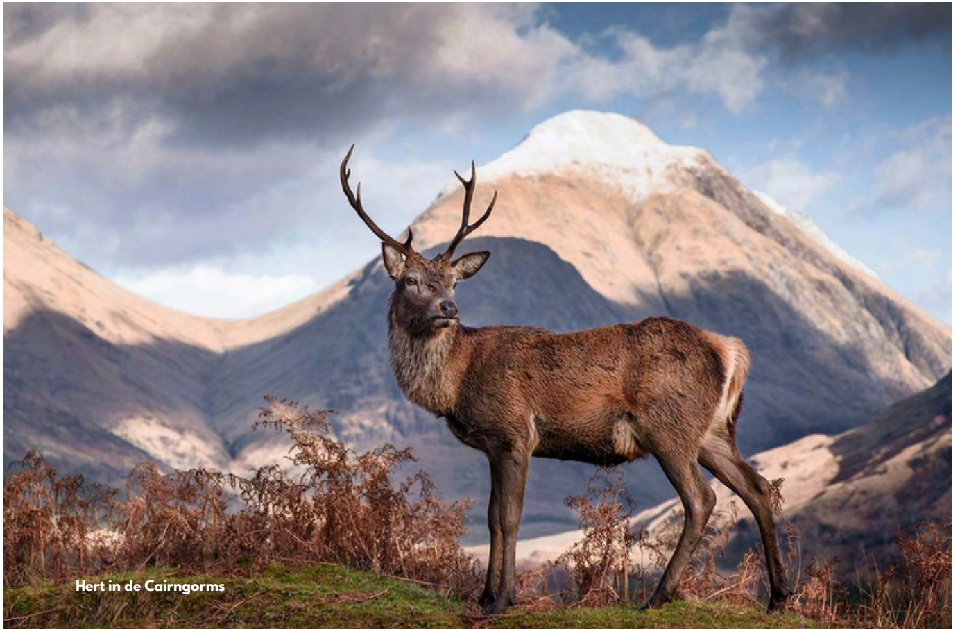
Hert in de Cairngorms