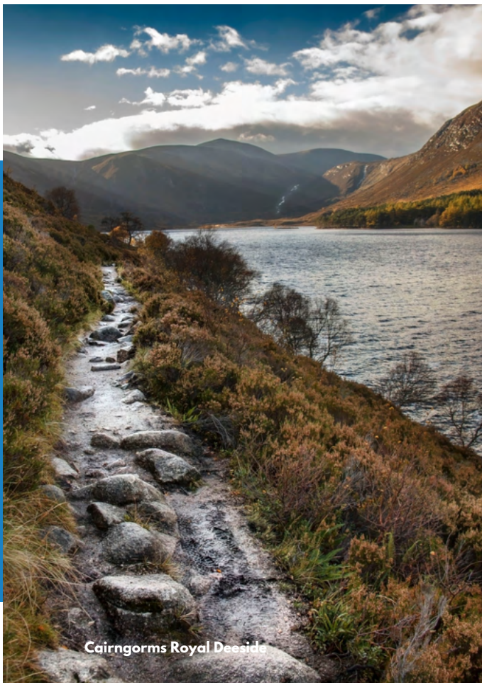
Cairngorms Royal Deeside