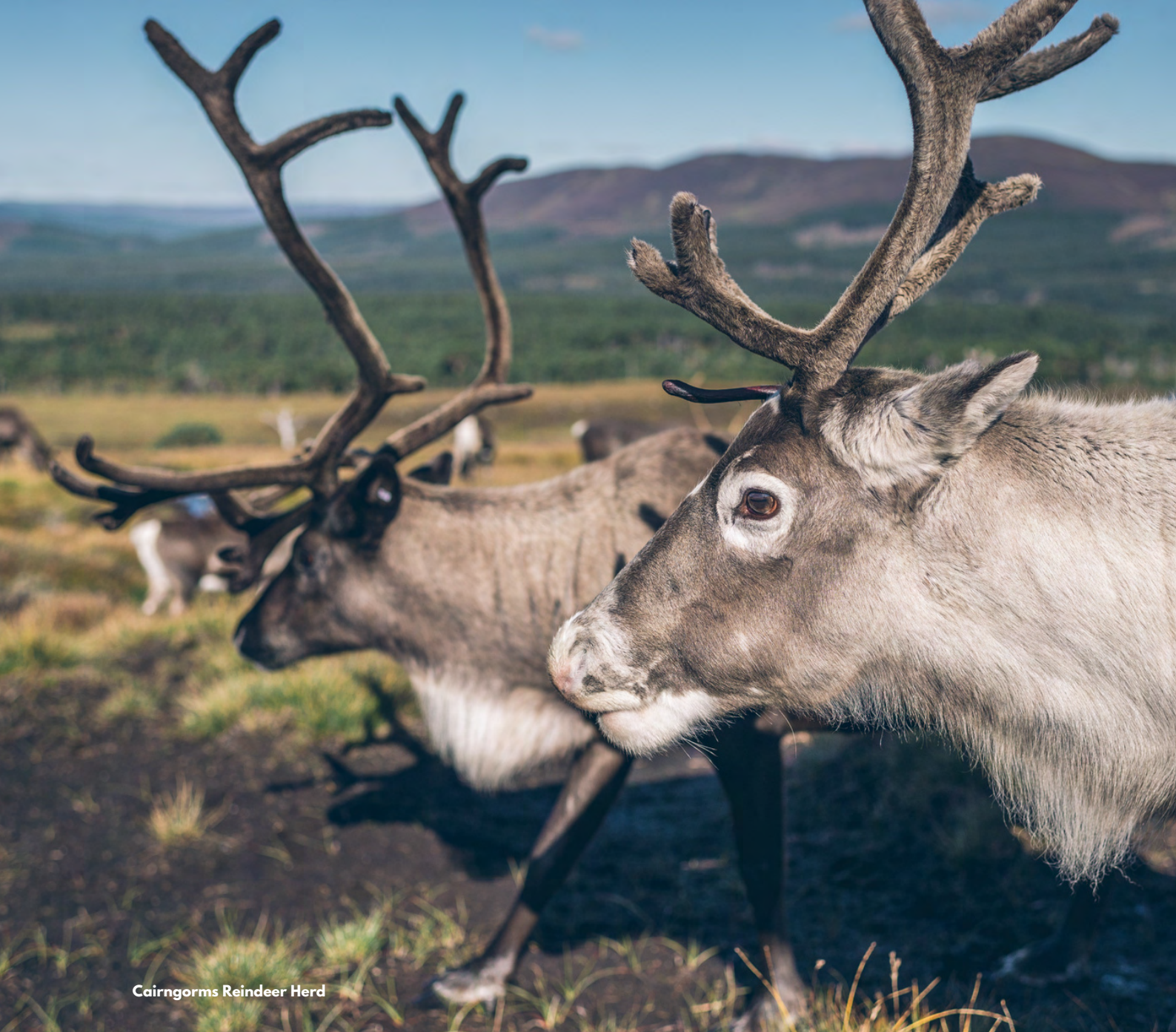
Cairngorms Reindeer Herd