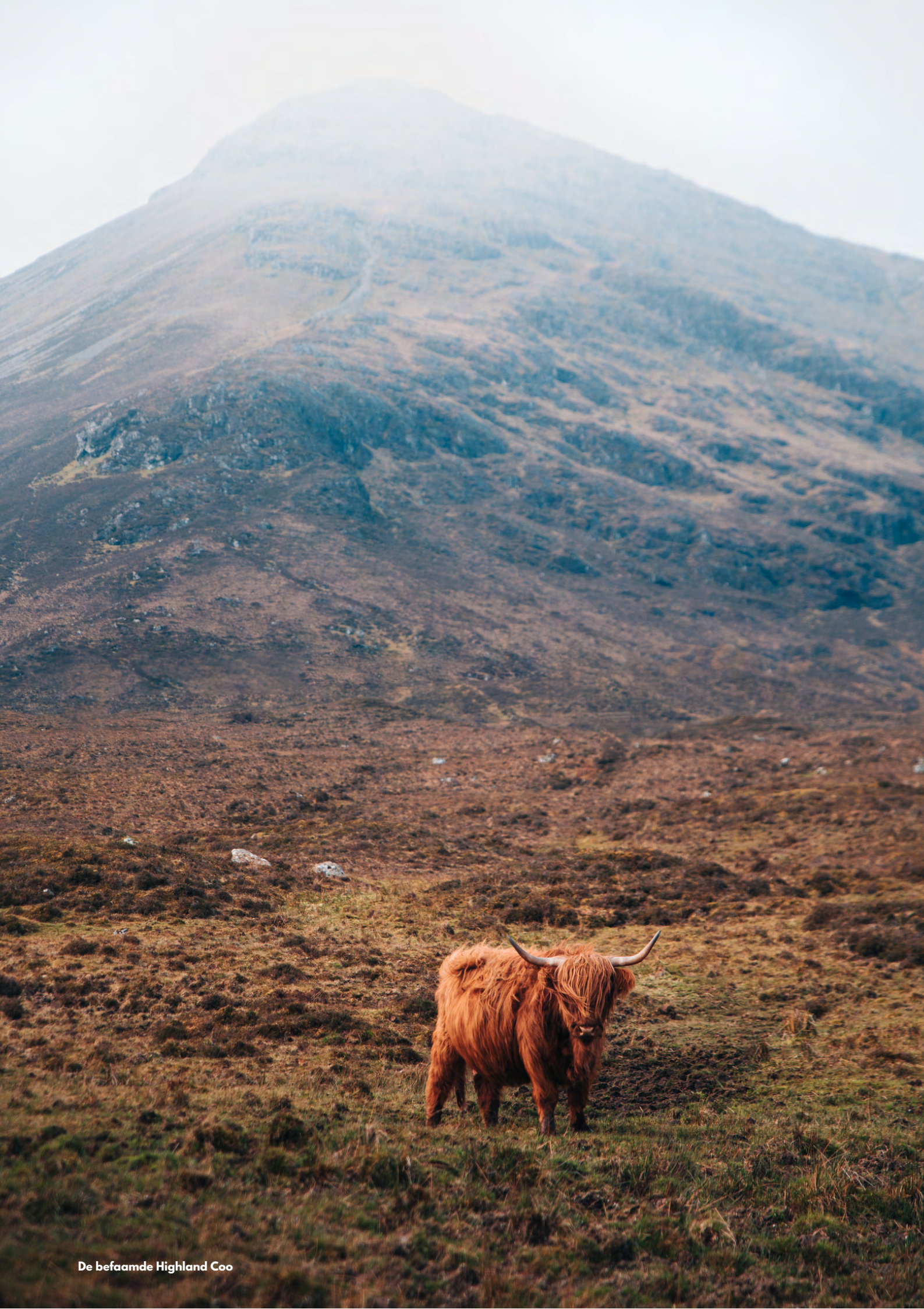
De befaamde Highland Cow