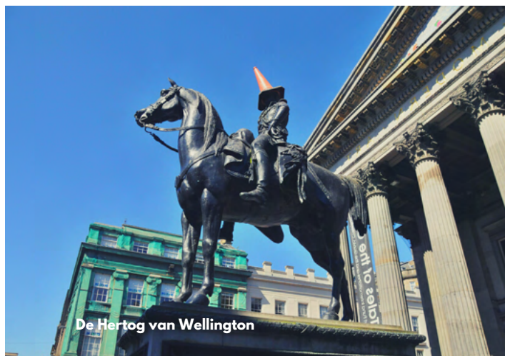
De Hertog van Wellington