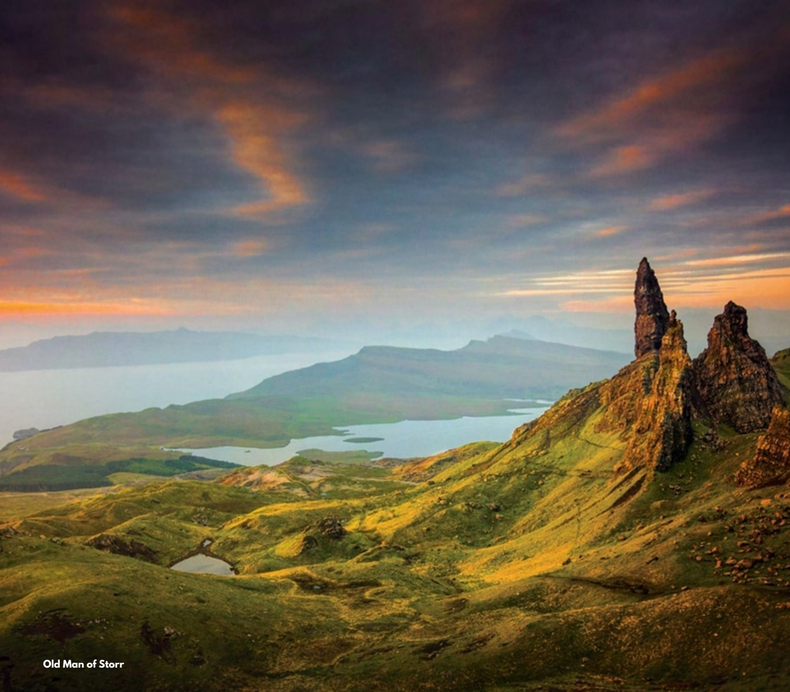
Old Man of Storr