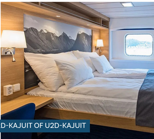
P2D-KAJUIT OF U2D-KAJUIT