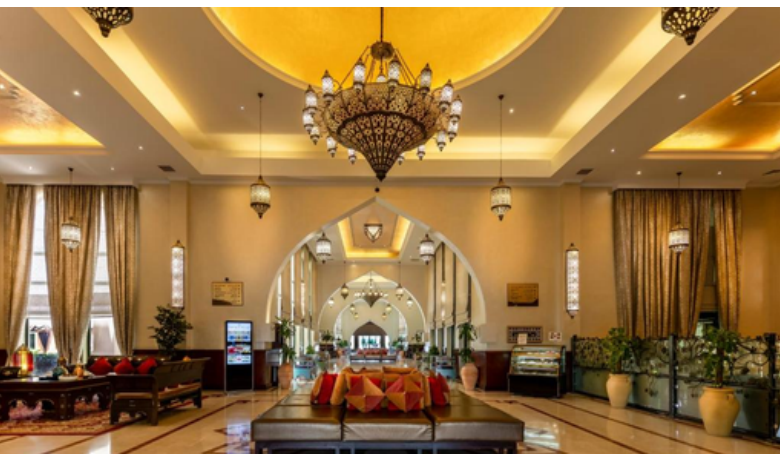
1 overnachting in Nizwa in hotel Golden Tulip ****