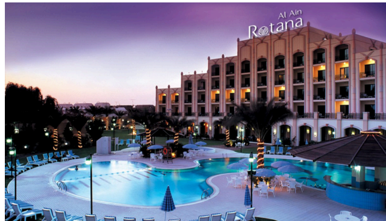
1 overnachting IN Al Ain in hotel Al Ain Rotana *****