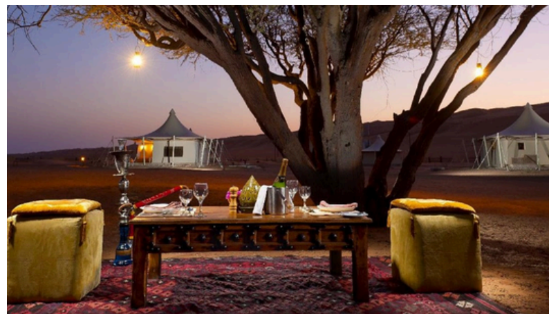
1 overnachting in de woestijn en luxekamp 1000 nights