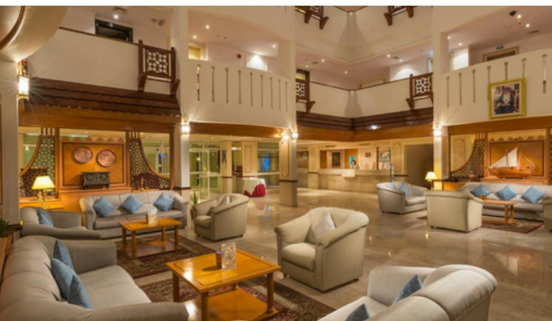
1 overnachting in Sur in hotel Sur Plaza ***