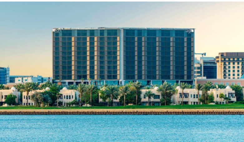
1 overnachting in Dubai in hotel Aloft ****